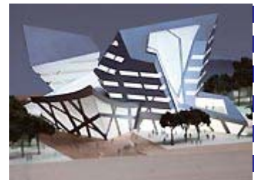
Entwurf des Audimax von Libeskind